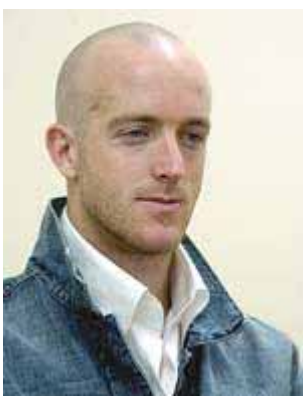
МЭТТЮ БУТ, ЗАЩИТНИК ФК «РОСТОВ» И СБОРНОЙ ЮАР